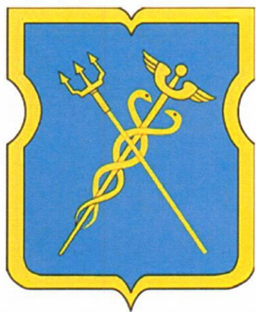
Многоцветное изображение герба муниципального округа Строгино